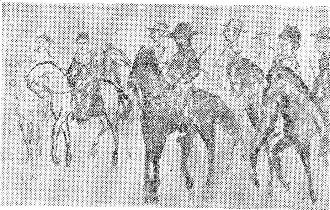
Desfile de jinetes y amazonas por los alrededores de la Glorieta en el pasado siglo. LA ULTIMA BORRASCA, cuadro de Heliodoro Guillén

Desde el Jueves Santo por la mañana, no se permitía la circulación por el centro de la ciudad a ninguna clase de carruajes. Los tranvías que entonces prestaban servicio, las tartanas, galeras y carros, quedaban en las afueras de la población sin que pudieran entrar en ella, hasta el toque de Gloria del Sábado. Con tanto rigor se llevaba esta prohibición, que para poder transportar hasta la estación del ferrocarril, las cajas que contenían los Santos Oleos consagrados por el obispo en la mañana del Jueves Santo, a las parroquias más lejanas de la diócesis, había que pedir a la Alcaldía un permiso especial para que los agentes de la autoridad permitieran la circulación del coche que las conducía. Y recordamos que hasta los niños se abstendían de