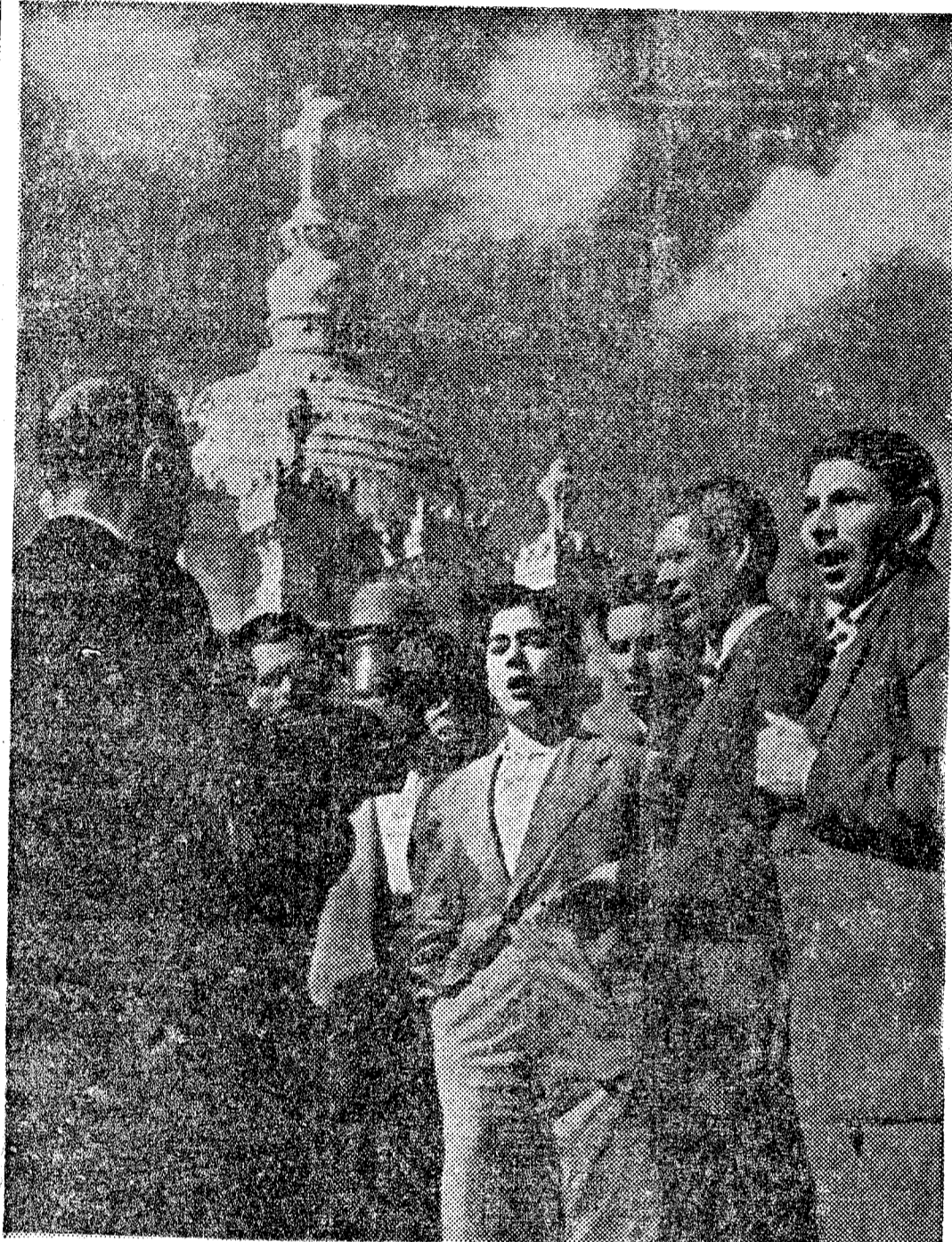
Un grupo de auroros canta la Salve de Difuntos en el cementerio de Nuestro Padre Jesús en la tarde del primero de noviembre