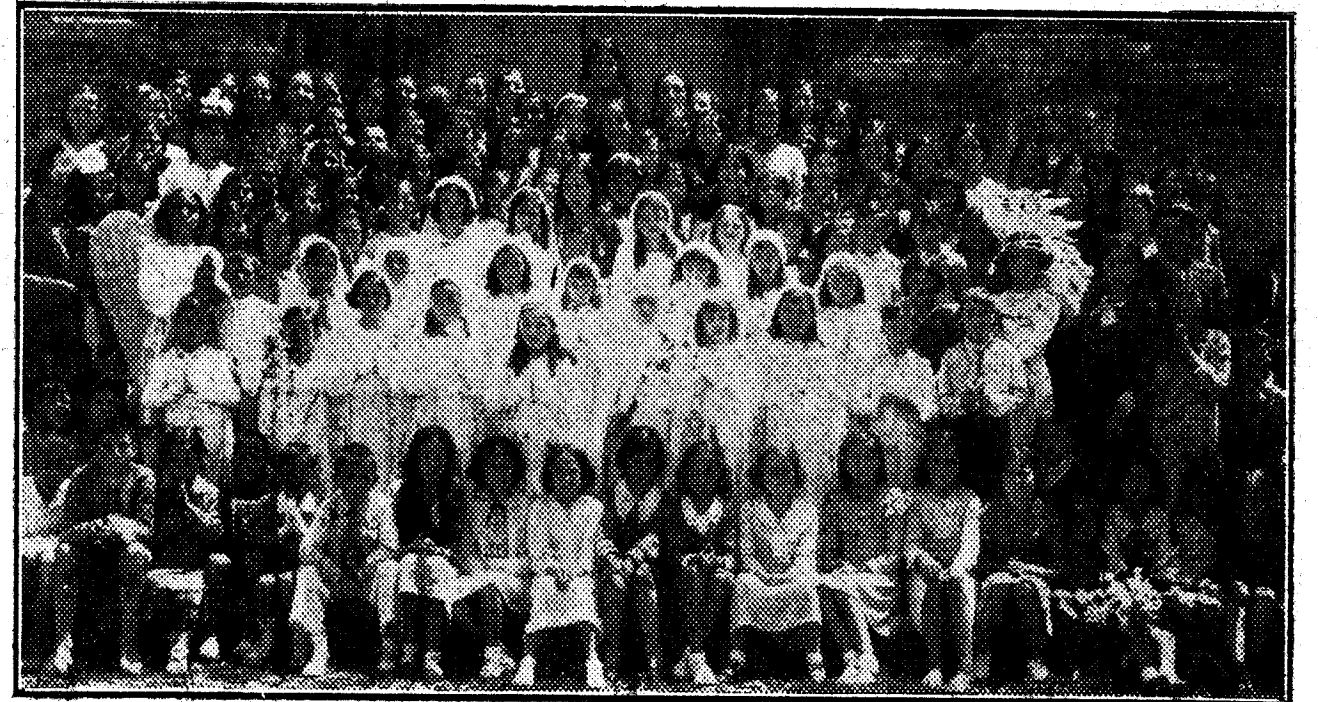
Niños que hicieron la primera comunión en la parroquia del Salvador de Caravaca, acompañados de las catequistas que los han instruido y preparado para tan solemne acto.