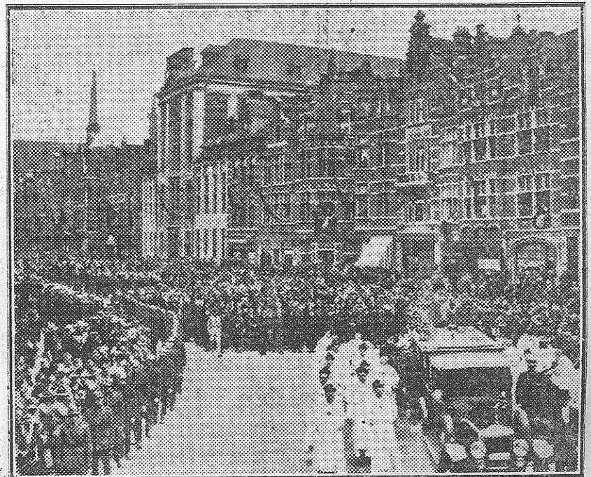
El cortejo, a su paso por una calle de Lovaina.