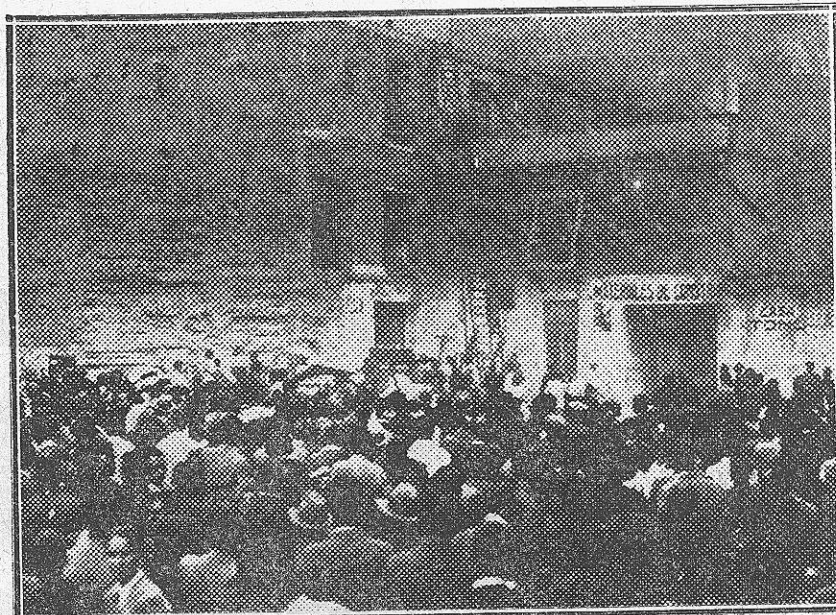
Un aspecto del numerosísimo público congregado en la plaza de Santa Eulalia.

Afortunadamente el arrojo del personal del Cuerpo de Bomberos y la ef-