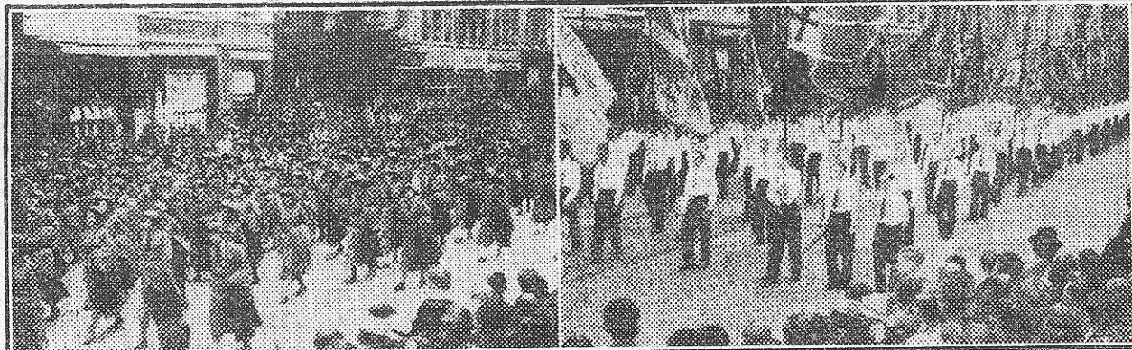
Las juventudes obreras belgas desfilan ante el catafalco en que se instaló el féretro del apóstol de los leprosos.

Bélgica rinde tributo entusiasta a su compatriota, misionero de los Sagrados Corazones