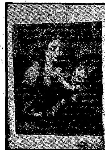
Cuadro napolitano de la Madre de Dios, que perteneció al cardenal Belluga

También escribe el marqués, asimismo en carta inédita, que el gentil hombre siciliano príncipe de Mondara, apellidado Paternó de Mondara, que estimaba ser pariente del cardenal, regaló a Su Eminencia el hermoso Crucifijo en mármol rojo y blanco que éste a su vez cedió a los religiosos filipenses para su iglesia de Murcia. Elegante Crucifijo y bastante bien sentido que sospecha-