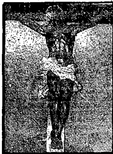
Crucifijo siciliano regalado por el cardenal Belluga a la iglesia de los PP. Filipenses, hoy de San José, de Murcia