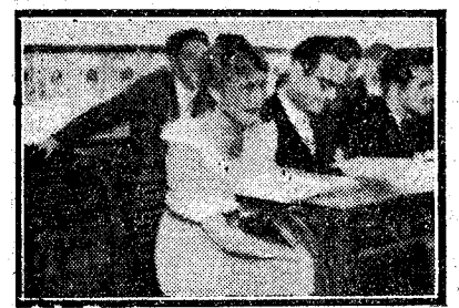
Estudiantes, malabaristas de programas iluminados, jugadores empedernidos en la lotería del examen...

La Universidad murciana, en su flamante albergue abierto a todas