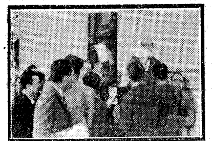
El asedio al bedel, que lleva en las manos la llave de las penas o las satisfacciones de los estudiantes.

La de ellas, por innecesaria, no tiene la fuerza aniquiladora que ellos emplean, cuando las pupilas insomnes de sus balcones ponen rectángulos de luz en la noche—esa terrible noche anterior al examen—como síntoma de extrahumanos esfuerzos para contrarrestar con unas horas de sobreexcitación los muchos